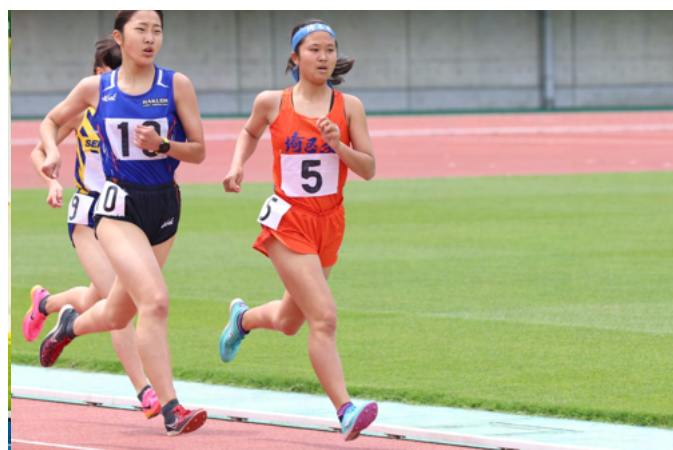
3年 近棟有桜 (川越大東西中)

1500m 5'15"25 → 4'43"77 3000m 11'38"00 → 9'52"81 2023 埼玉県高校総体 3000m 8位